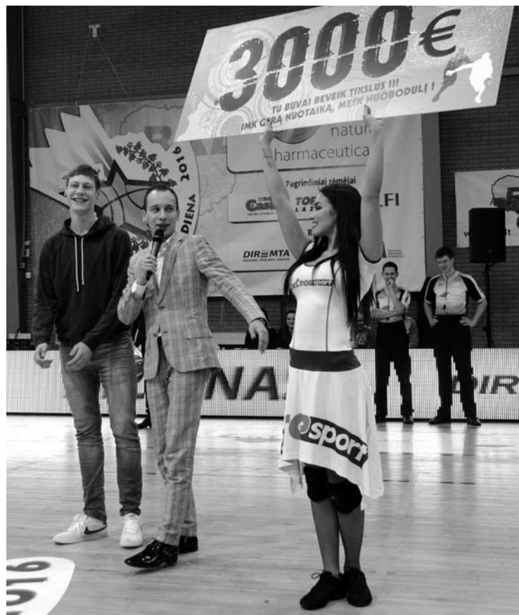
Jeigu vaikinai užrištomis akimis iš vidurio aikštės būtų pataikę į krepšį, būtų gavę 3000 eurų čekį...