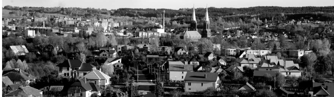
Per metus Anykščių rajonas neteko 620 gyventojų.

Lietuvos statistikos departamentas skelbia duomenis apie gyventojų skaičiaus pokytį per metus. Anykščių rajonas yra vienas iš tų, kuriame gyventojų mažėjimas vyksta sparčiausiai. O per 20 metų žymiai sumažėjo ir Anykščių rajone esantys miestai.