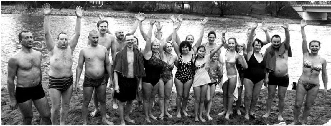
Po maudynių sveikuoliai rengtis neskubėjo, fotografavosi.