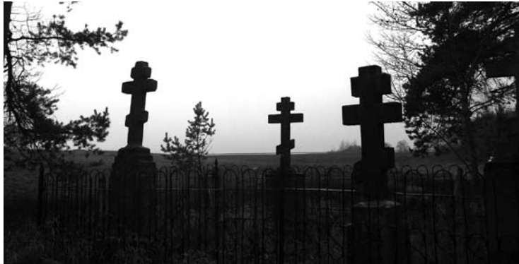
Senujų sentikių kapinių amžina ramybė.

Jau vėliau taryba sovietinėje armijoje likimą lėmė - sako, kad peršalo, sako, kad gal ir kokios radiacijos nepakeliamą porciją gavo, tad pradėjo sirginti, ten, kur jautriausia, liga puolė ir vos trisdešimties Vyžuonų šilėje atgulė. Susitinku jo dukrą, net ir tais pačiais išėjimo anapus metais gimusių sūnų - nuostabaus nuoširdumo jaunuoliai, tarsi ne iš šio pasaulio, bet iš kito, kažkada jau bu-