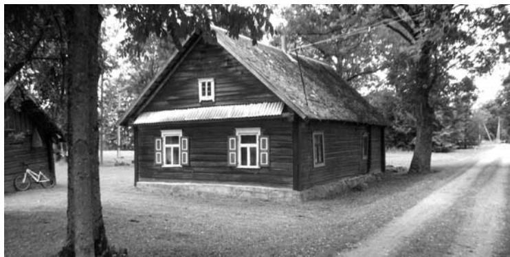
Šventupio senovės atspindys - Kažukauskų troba.

pasakota žinia ir mūsų laikus pasiekia: pačioje XX amžiaus pradžioje didelis gaisras buvęs, visas kupertą stūksojęs sentikių kaimelis ir jų šventovė liepsnose žuvo. Matyt, po to pasklido rusai po visą apylinkę, Šventupyje tik jų kapinaitės tepaliko. Paslaptingos, medine tvora nuo amžių apjuostos, keistais, skersiniu perdalytais kryžiais ir neregėto sturmo pušimis šimtametėmis apkašytos. Pačia pakape upelis nedidu-